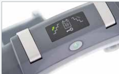
Übersichtliches Display: alle Funktionen im Blick