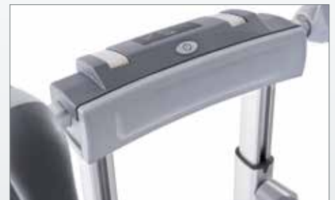
Komfortpolster: zum Ablegen der Bedieneinheit auf dem Oberschenkel