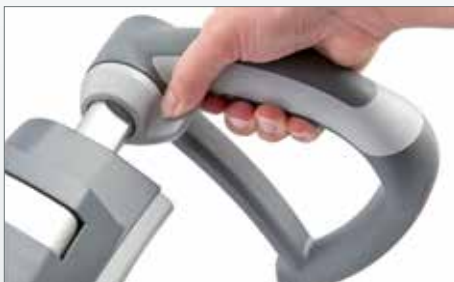
Ergobalance-Griffe: rutschsicher und handlich geformt

scalamobil und scalacombi passen sich Ihnen an – nicht umgekehrt. Die Griffeinheit ist in Höhe und Breite einstellbar und passt sich somit jeder Bedienperson und Treppe optimal an.